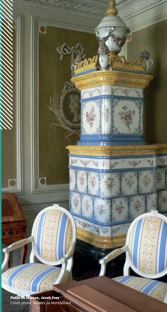
Poêle en faïence, Jacob Frey