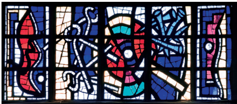
Vitrail de Fernand Léger, église du Sacré-Cœur à Audincourt