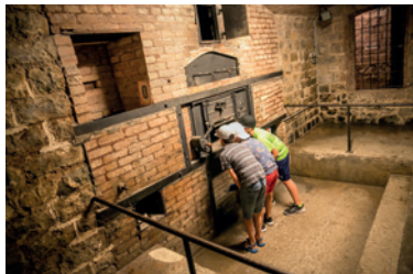
Four à pain du Fort du Mont-Bart