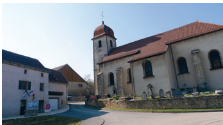
Église de Goux-lès-Dambelin